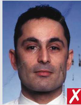
marca de tinta ou vinco